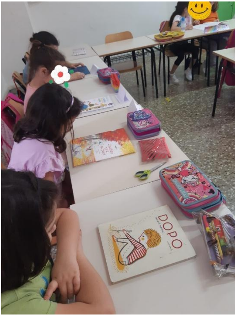
OSSERVIAMO LE IMMAGINI DI UN LIBRO E CERCHIAMO DI INTERPRETARE LA STORIA.