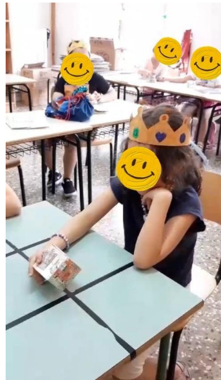
GIOCHIAMO CON IL CUBO CANTASTORIE: OSSERVO LE IMMAGINI E RACCONTO.