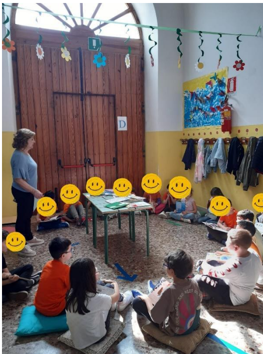
TUTTI INSIEME, ATTENTI, AD ASCOLTARE UNA STORIA RACCONTATA DALLA MAESTRA